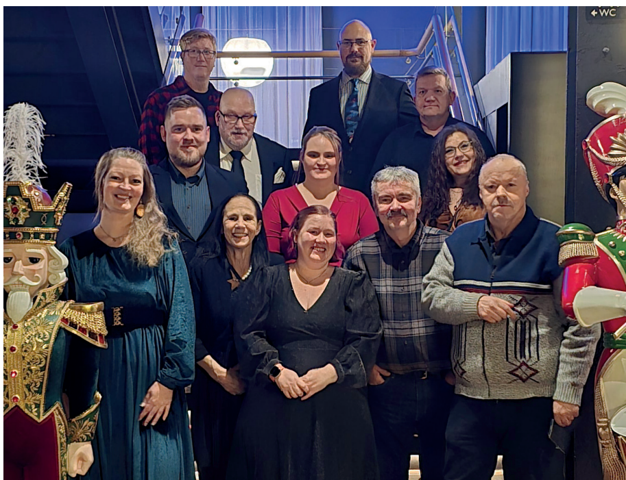
Gruppebilde av deltakerne som var med på julebord.

Vanligvis blir flere foreninger, lag og firmaer presentert, men denne kvelden var det travelt, da hele 400 personer