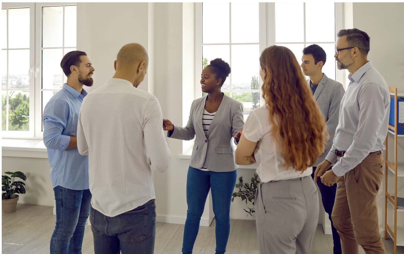
Illustrasjonsbilde fra Shutterstock