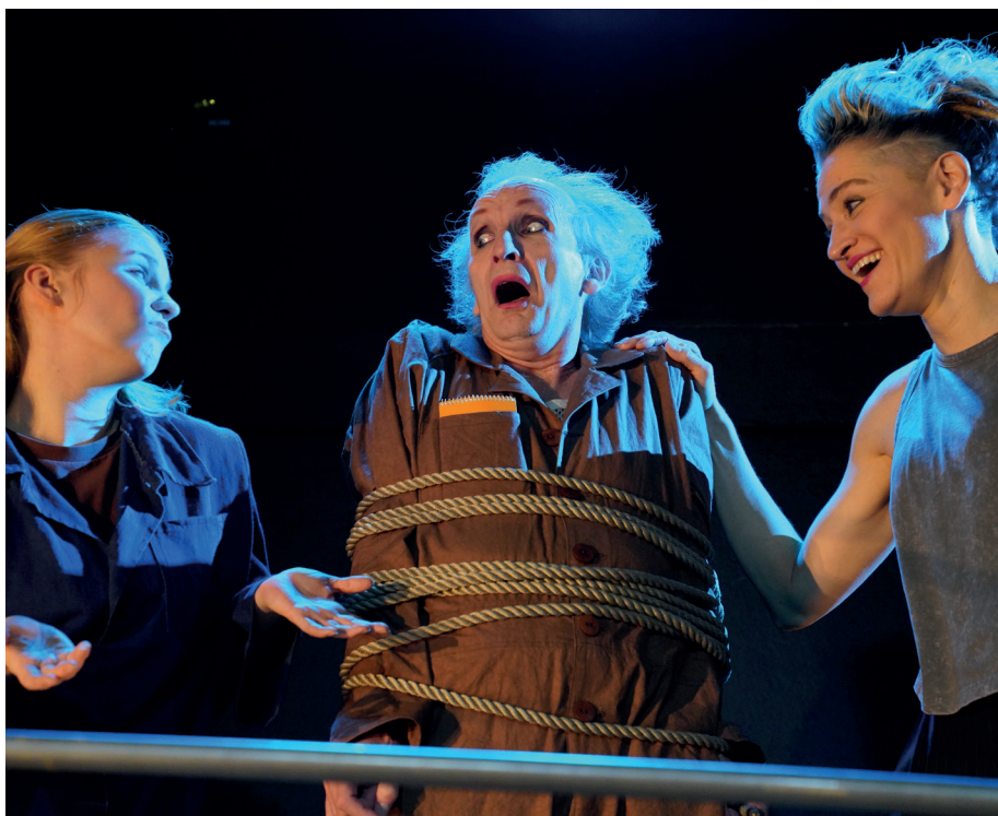
Lysistrata – På Teater Manu.

Ikea-installasjonen gjør tjeneste som det meste. Den er Akropolis, athenernes hellige fjell. Den er hjemmets lune stue, soverommets seng og strippeklubbenes svingstang. Publikum kastes fra det ene til det andre i et høyt tempo, med tusener av små detaljer som til sammen danner et stort, fascinerende hele. De gamle mennene står på sitt, men kvinnene får etter hvert de unge mennene med på det som er vanskelig for oss mennesker: å utsette et individuelt behov for å vinne et gode for alle – fred.