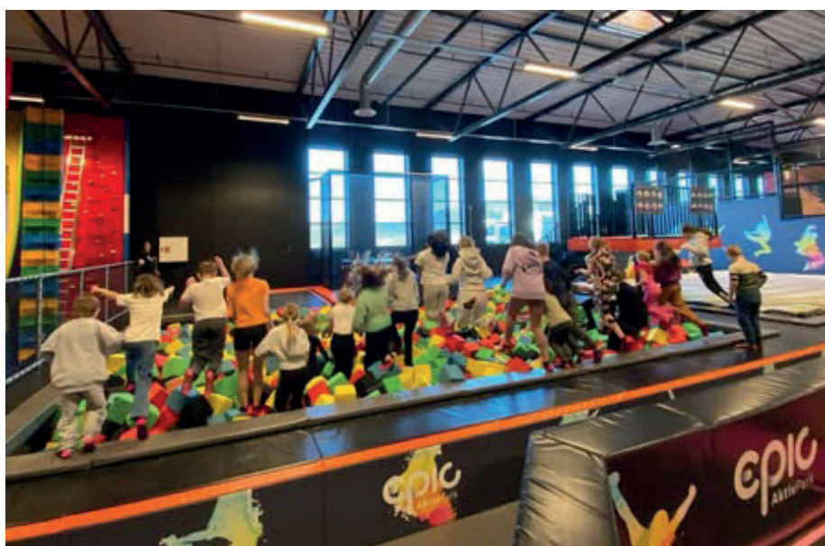
Glade barn hopper ned i skumbasseng full av skumputer.

Trenger vi å si at jubelen sto i taket da NDF Møre og Romsdal ga oss hele 10 000 kroner? De mener at dette er et veldig godt tiltak opp mot barn og unge! HLF Sunnmøre har også vært svært positive til tiltaket, så vi venter spent på svar på årets søknad.