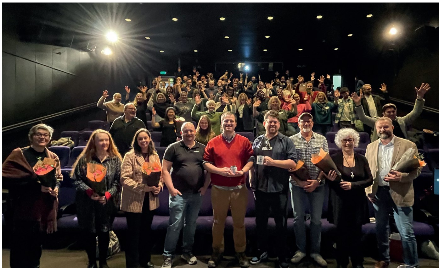
Gruppebilde av alle deltakerne og foredragsholdere.

produksjon. Tidligere var det i hovedsak Statped og Døves Media som laget tegnspråkfilm, men etter at vi etablerte Supervisuell har det kommet flere aktører, både frilansere og selskaper, som ønsker å produsere innhold på tegnspråk. Vi ser også at større