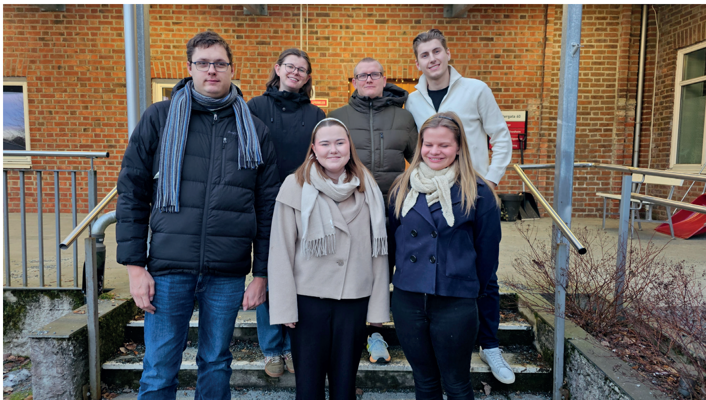
Gruppebilde av NDFU-styret.