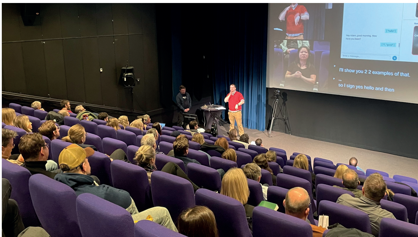
I år kom rundt 80 personer til fagdagen for tegnspråkproduksjon i Sandefjord.