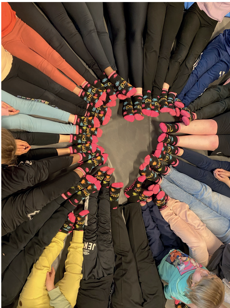
Venner for livet? <3