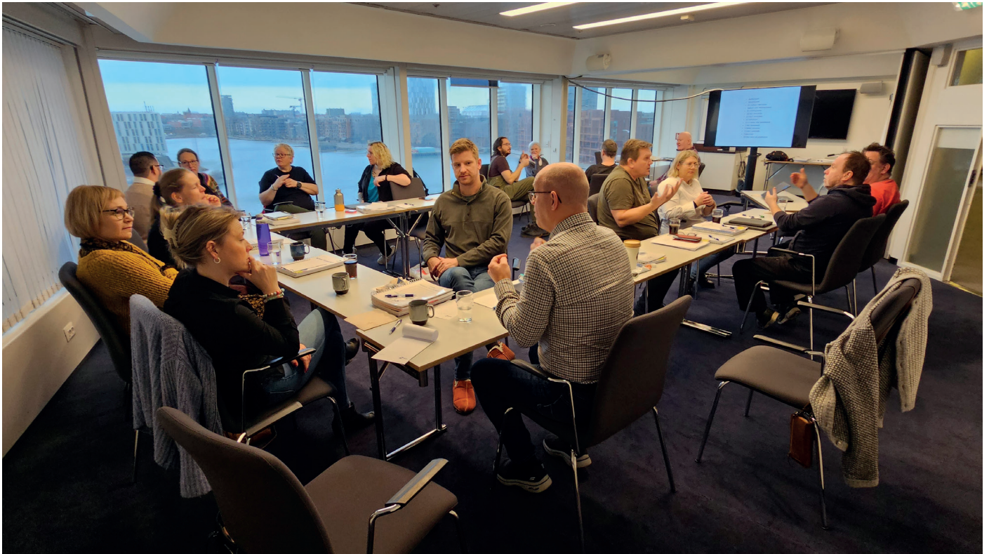
Tegnspråklærere fra lokalforeninger deltar i seminar om bord på DFDS-skipet fra Oslo–København–Oslo.