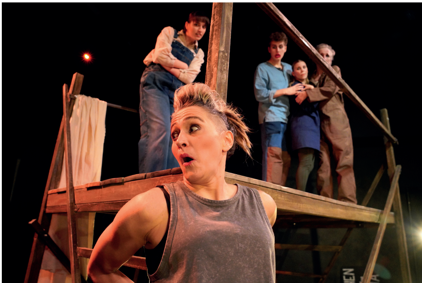
Lysistrata – På Teater Manu.